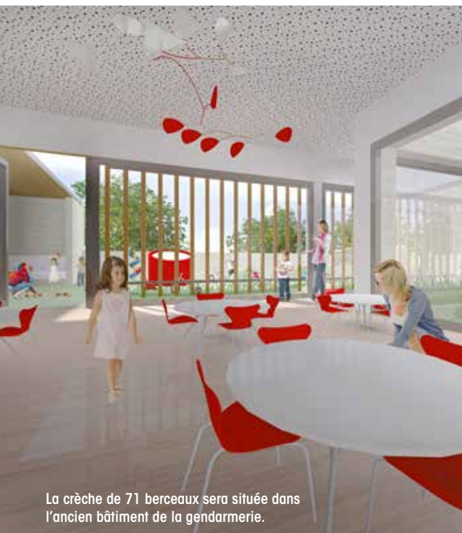
La crèche de 71 berceaux sera située dans l'ancien bâtiment de la gendarmerie.

Le site choisi pour l'implantation de cette maison multi-accueil est celui de l'ancienne gendarmerie située boulevard Gambetta. Le terrain de la gendarmerie contient lui-même divers bâtiments d'époque, d'usages et de qualités différents dont il convient d'établir un inventaire en vue d'en évaluer le potentiel.